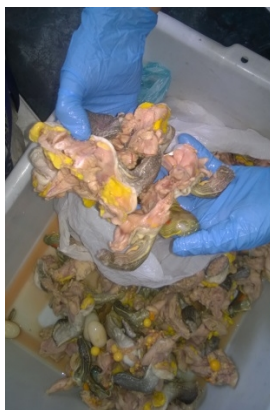
Figura 2. Verificación de 3,912 kg de Trachemys callirostris . Acta Única de Incautación No. 0002991

Esta especie se caracteriza por ser acuática, por tener la cabeza completamente lisa, tener un caparazón usualmente bajo y arqueado y un plastrón grande y bien desarrollado. Tiene el iris amarillo y la cabeza verde oliva, ornamentada con cintas longitudinales amarillas, y manchas redondeadas sobre el mentón y mandíbulas.