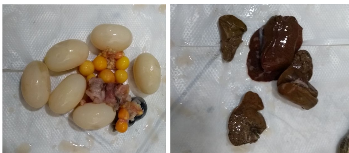
Figura 7. Partes de Tortuga icotea ( Trachemys callirostris ) incautadas, huevos y algunas vísceras.

Evaluación inicial de los subproductos: Evaluación inicial de los subproductos: Se evidencia que se realizó un aprovechamiento ilegal de fauna silvestre en donde se pudo determinar que se hizo una movilización ilegal de una cantidad considerable de carne de tortuga y que dentro de esta se encontró un gran número de huevos pudiendo determinar