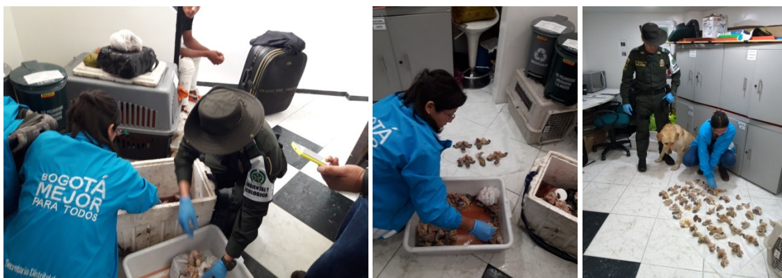
Figura 1. Procedimiento de incautación de 3,912 kg de Trachemys callirostris . Acta Única de Incautación No. 0002991

El equipaje correspondía a una cava de refrigeración cuyo contenido fue verificado por los profesionales de la SDA encontrando partes de varias tortugas de la especie Trachemys callirostris , que corresponde a la fauna silvestre colombiana. Al practicarse la verificación por parte del profesional de la Secretaría Distrital de Ambiente, se corroboró que se trataba de 1,4 kg de carne y huevos, cuyas características morfológicas y caracteres diagnósticos descritos en el numeral 4. (CONCEPTO Y ANÁLISIS TÉCNICO), permitieron determinar que pertenecen a la especie ( Trachemys callirostris )– Tortuga Icoetea, pertenecientes a la fauna silvestre colombiana (Figura 1).