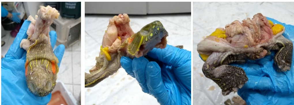
Figura 6. Carne incautada de Tortuga icotea ( Trachemys callirostris ), nótese cabeza, extremidades anteriores y posteriores.