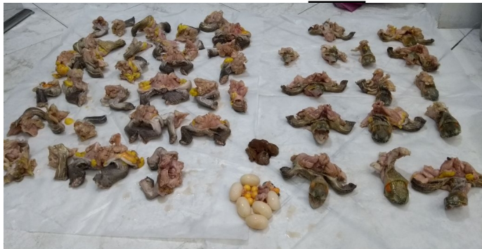
Figura 4 y 5. Carne incautada de Tortuga icotea ( Trachemys callirostris ), nótese cabezas, extremidades anteriores, posteriores y algunas vísceras.